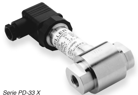
Serie PD-33 X