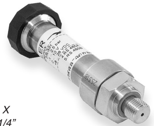
Serie 33 X rosca G1/4"

El rango de medida del manómetro se puede ajustar a cualquier estándar de presión corrigiendo la ganancia del manómetro con el correspondiente software de calibración.