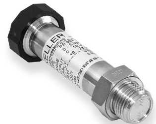
Serie 35 X G1/2", membrana enrasada